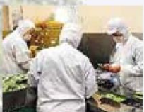
インターンシップ