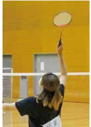
左：入学式（4月） 上・右：定時制通信制 体育大会（6月）